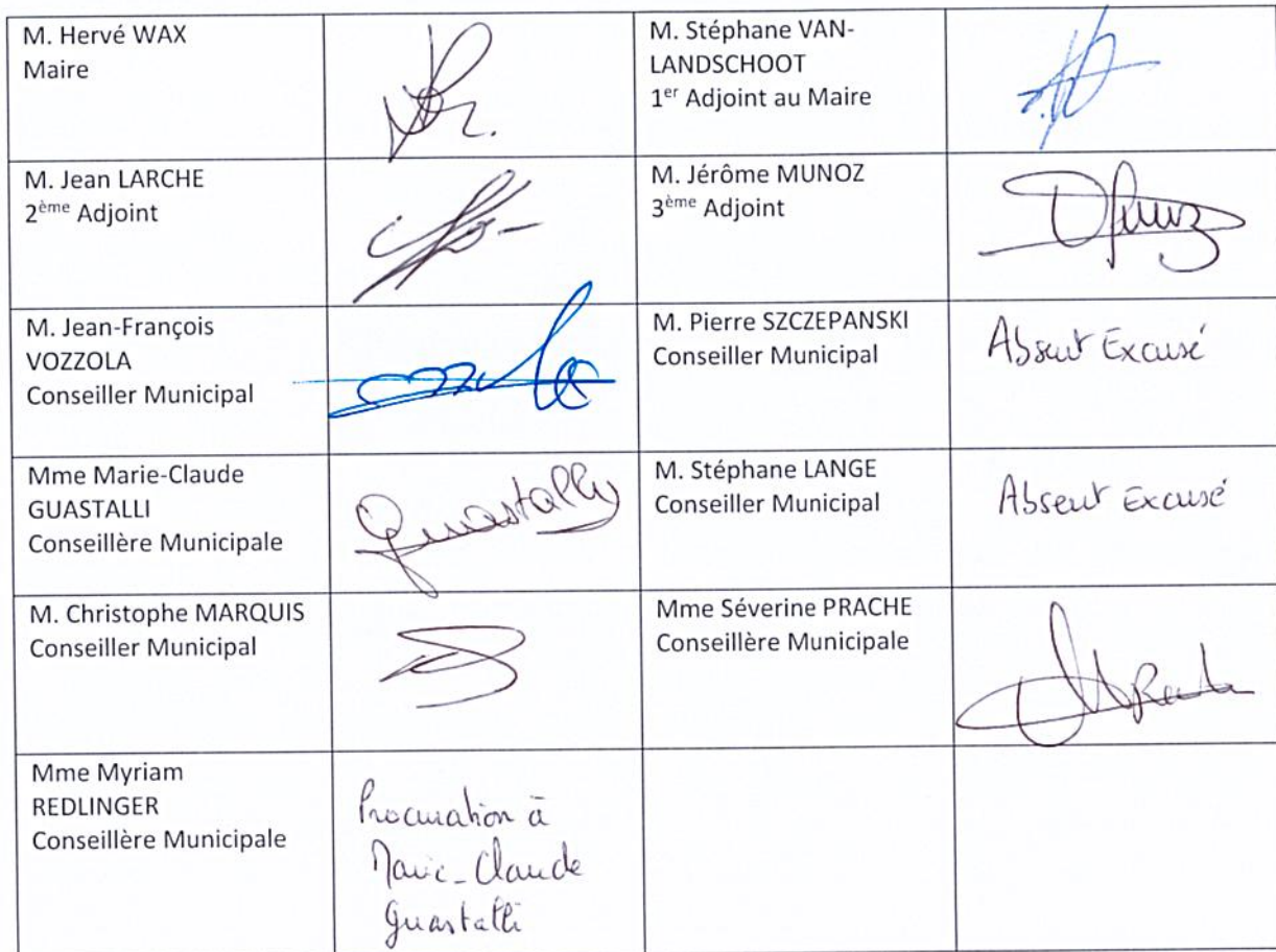
TABLEAU DES MEMBRES PRESENTS