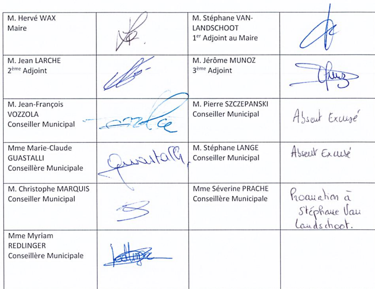
TABLEAU DES MEMBRES PRESENTS